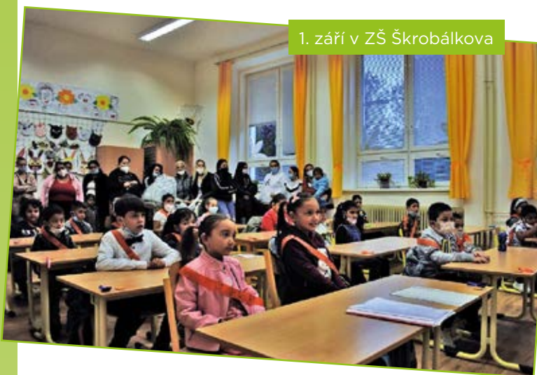
1. září v ZŠ Škrobálkova