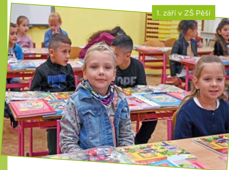
1. září v ZŠ Pěší