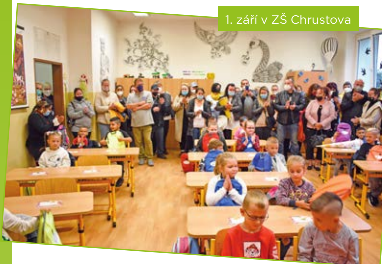
1. září v ZŠ Chrustova

Novinkou v základní škole v Kunčičkách se již brzy stane nyní budovaný altán na školní zahradě. Bude žákům sloužit jako náhradní školní třída v období, kdy to dovolí počasí.