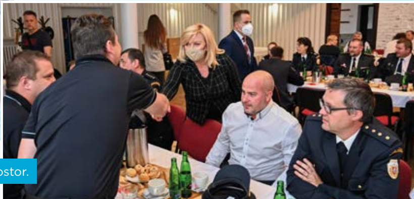
Návštěva shromáždění hasičů v muglinovské restauraci Prostor.