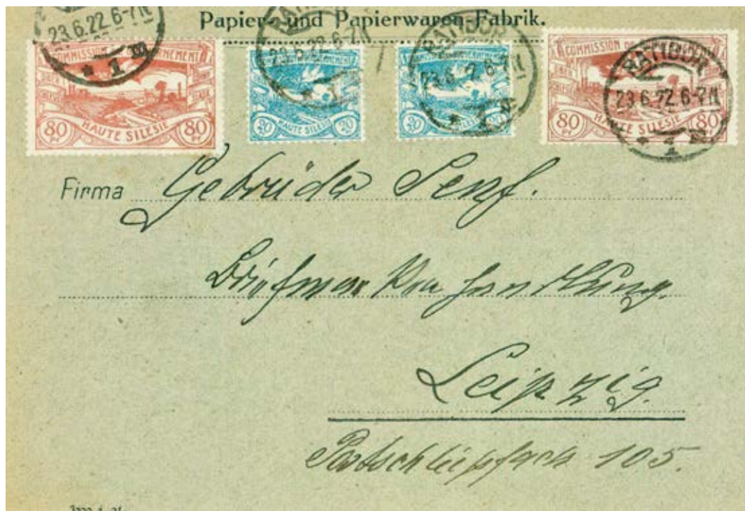
Na snímku obálky dopisu zasláného z Ratiboře do Lipska z roku 1922 jsou tzv. plebiscitní poštovní známky. Jsou vzácné a málo známé, proto filatelisty vyhledávané.