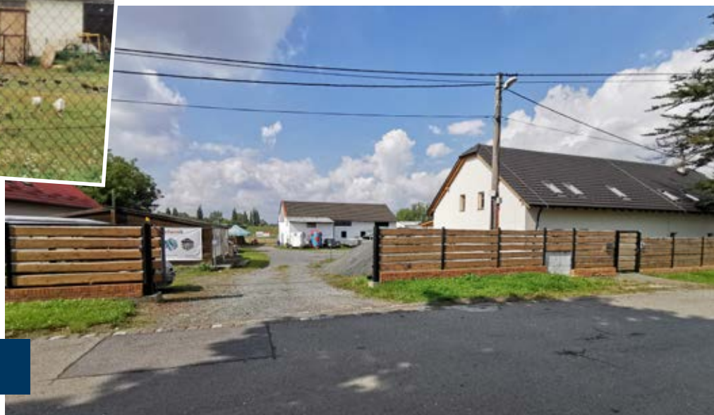
Středisko Dvoreček v Kunčičkách v roce 1997 a současnosti.