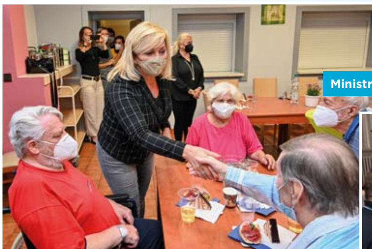
Ministryně Alena Schillerová se zdraví se seniory v DPS Hladnovská.